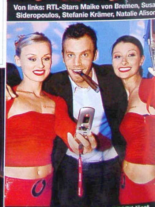
Dominic Boer („Star Duell“ & „GZSZ“) lässt sich von Vodafone-Hostessen fotografieren